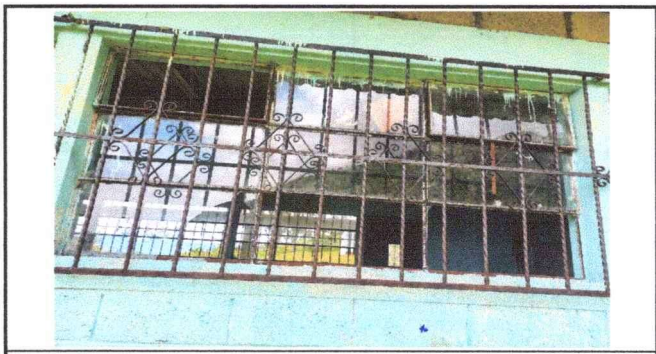
Foto 6: Mejoramiento de piso, ventanas y puertas de un aula para tercero primaria

Observación: Si es necesario se pueden agregar hojas adicionales y actualizar el número de hojas.