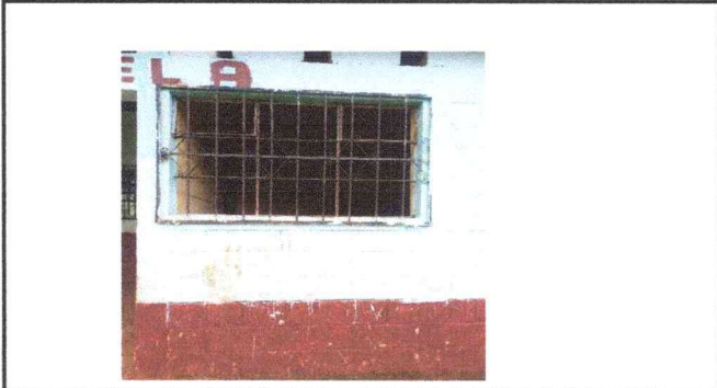
Foto 3: Mejoramiento de piso, ventanas y puertas de un aula para tercero primaria