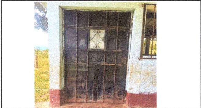
Foto 4: Mejoramiento de piso, ventanas y puertas de un aula para tercero primaria